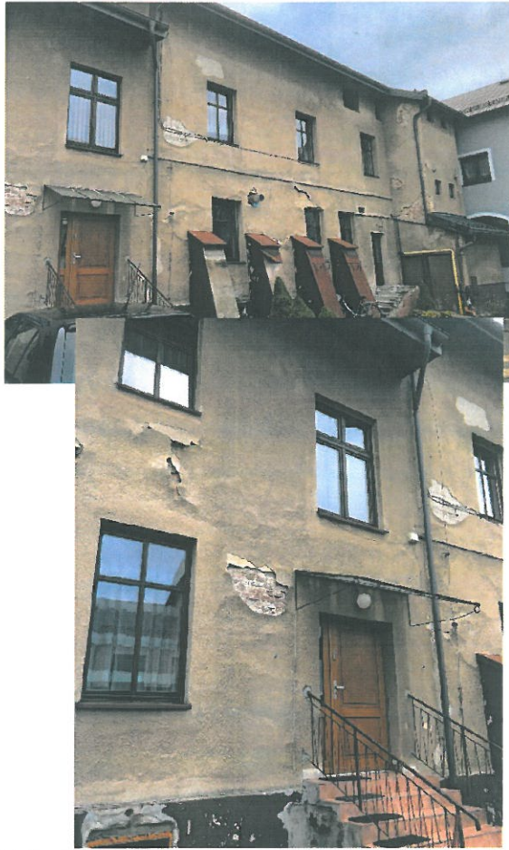
Zdj. 1 Elewacja tylna.

Całość starego zdegradowanego tynku skuć, elewacje oczyścić, odpylić i docieplić systemem Sempre Term WM z wełną mineralną i tynkiem Azuro Premium 1mm zgodnie z Instrukcją Docieplenia Sempre.