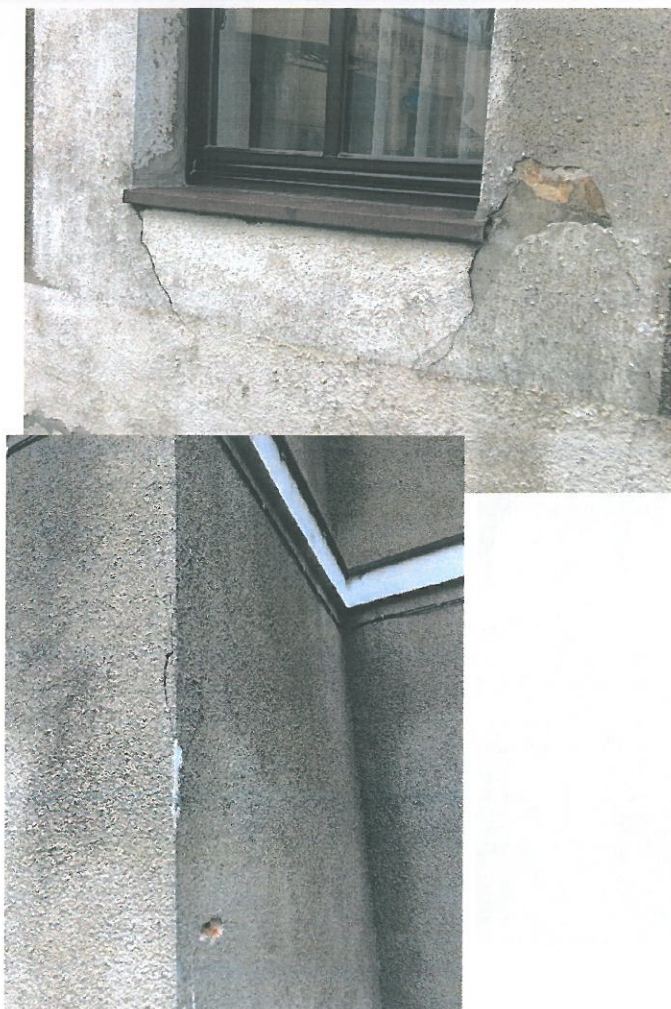
Zdj. 2 Pęknięcia.