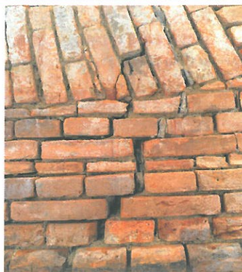
Zdj.3 Skuty i tynk i oczyszczone spoiny