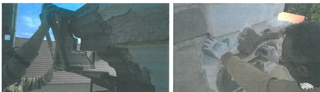
Zdj. 4 wykonanie sztukaterii